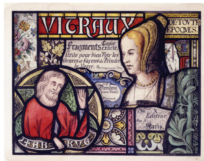
Ferdinand Dandois, Vitraux de toutes époques... , dessin, s. d., Paris, musée Carnavalet

MERCREDI 26 MARS 2025 DE 18 H À 20 H GALERIE COLBERT SALLE INGRES (2 e ÉTAGE) 2 RUE VIVIENNE 75002 PARIS ENTRÉE LIBRE