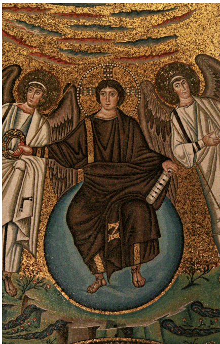
Le Christ. Saint-Vital de Ravenne, milieu VI e siècle

On sait que ce n'est qu'au début du III e siècle, qu'un art chrétien a émergé. On se rend moins compte du temps qui a été nécessaire pour qu'une image stable du Christ se mette en place. Il s'agira de comprendre cette métamorphose qui va du III e au VII e siècle. Elle est, certes, liée à l'évolution de la christologie, à la réflexion sur les natures humaine et divine du Christ, mais plus profondément, à une lente mutation du monde romain dont le christianisme n'est pas la seule source.