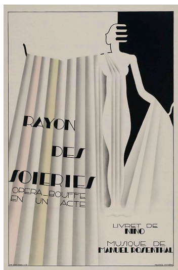
Maurice Dufèvre, Rayon des soieries . Opéra-bouffe en un acte, 1930, affiche, coll. J. Cerman

décoratifs français durant un demi-siècle, poursuivant dans l'entre-deux-guerres une carrière lui valant de nombreux titres et distinctions, Dufèvre sut constamment adapter sa production à l'évolution du goût. Cette communication portera plus spécifiquement sur la dimension commerciale de ce parcours aux nombreuses facettes. Depuis sa contribution autour de 1900 au magasin La Maison Moderne de Julius Meier-Graefe (1867-1937) jusqu'à la direction artistique des ateliers d'arts appliqués La Maîtrise des Galeries Lafayette qu'il assure à partir de 1921, cette activité émanait d'une volonté de démocratisation des arts décoratifs, idéal hérité de l'Art nouveau et qui perdure au temps de l'Art déco.