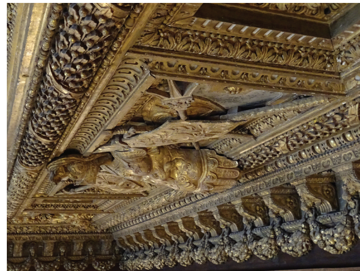
Plafond de la chambre de Henri II au Louvre, 1556.

MERCREDI 17 JANVIER 2024 À 18 H GALERIE COLBERT SALLE VASARI (1 ER ÉTAGE) 2 RUE VIVIENNE 75002 PARIS ENTRÉE LIBRE