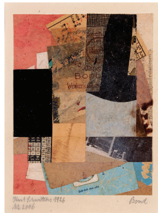
Kurt Schwitters, Mz 2006 Bond, 1926, collage, 16,5 x 12,5 cm. Paris, Musée national d'Art Moderne

En première page : Couverture du catalogue de l'exposition « Chaosmose ».