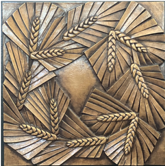
Raymond Subes, détail d'un banc de communion, cathédrale Notre-Dame-et-Saint-Vaast, Arras