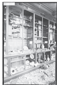
Emmanuel-Louis Mas, Vitrine de céramiques chinoises au Musée de la Manufacture nationale de céramique de Sèvres, au lendemain du bombardement du 3 mars 1942, Musée de la Manufacture nationale de céramique