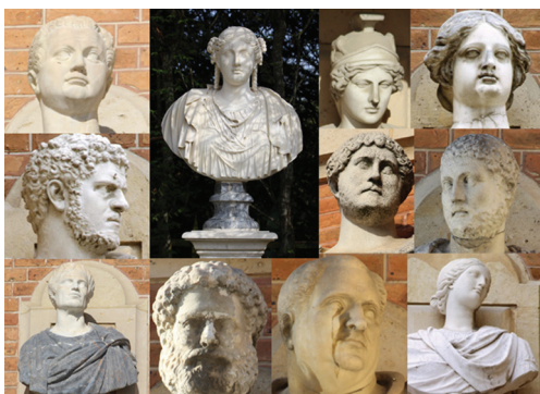
Effigies impériales romaines à la cour de Marbre et à la cour Royale du musée national des châteaux de Versailles et de Trianon