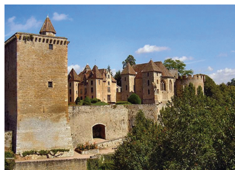
Château de Couches.