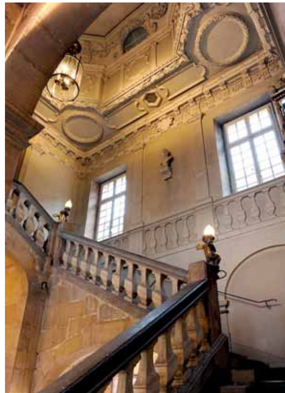
Hôtel Lantin, escalier principal (1663)

Cinquante-quatre demeures historiques sont analysées en détail, pour mettre en évidence l'évolution de leur architecture. L'auteur replace l'architecture patricienne provinciale dans la France du Grand Siècle : Paris, la première référence, mais aussi Aix-en-Provence, Bordeaux, Montpellier, Rouen ou encore Toulouse. Cet ouvrage s'inscrit dans la redécouverte d'un très riche patrimoine et a bénéficié d'une campagne photographique qui révèle de nombreux édifices privés d'ordinaire peu accessibles.