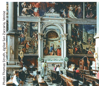
église San Zaccaria, Venise

http://www.centrechastel.paris-sorbonne.fr/