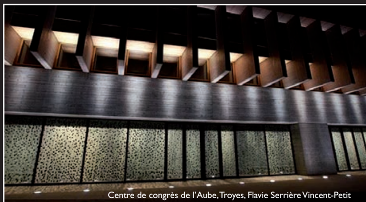
Centre de congrès de l'Aube, Troyes, Flavie Serrière Vincent-Petit