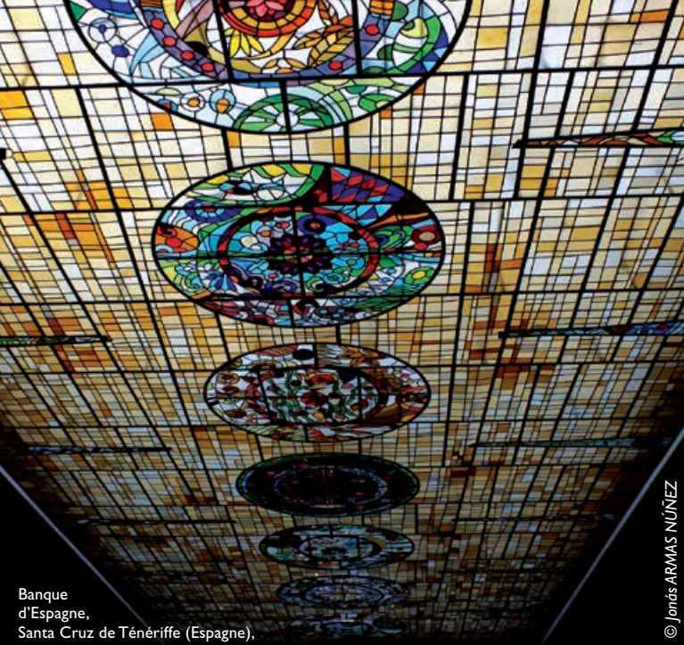
Banque d'Espagne, Santa Cruz de Ténériffe (Espagne), Atelier Giraldo