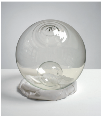
John Latham, Least Event as Habit , 1970. Two sealed glass spheres with vacuums.

L'art conceptuel est souvent défini comme une entreprise de « dématérialisation de l'objet d'art ». Due à la critique d'art Lucy Lippard, cette formule n'a cessé en même temps de susciter la controverse depuis ses premières occurrences au tournant des années 1960/1970. Cette communication propose d'apporter un éclairage sur l'épineux problème du statut de l'objet et de la matière dans l'art conceptuel en s'appuyant sur certaines des sources scientifiques employées par les artistes rattachés à ce courant. Peu étudiées jusqu'à présent, ces sources permettent cependant de sortir d'une approche idéaliste de