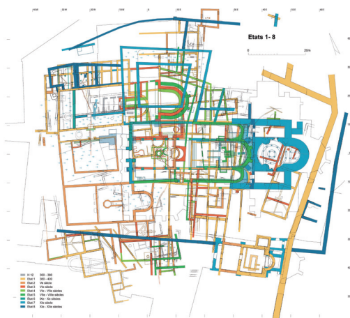
Plan synthétique des fouilles de la cathédrale de Genève de l'Antiquité tardive au XII e siècle (Genève, Service cantonal d'archéologie)

Après plus de trente années de recherches archéologiques à l'intérieur et autour de la cathédrale Saint-Pierre, nous avons mis en évidence la naissance de la ville antique de Genua. Vers 350 déjà, un petit bâtiment marque les origines chrétiennes, deux tombes lui sont associées. Cet oratoire a été conservé en place durant le chantier de la première église épiscopale jusqu'à son achèvement à la fin du IV e siècle. Un baptistère va aussi remplacer le temple central romain, il constitue le noyau d'un vaste quartier religieux qui ne cesse de se