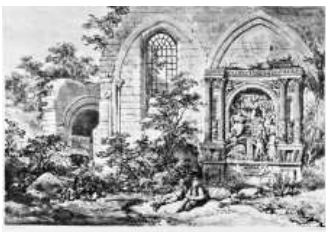
Ruines de l'église de Berthancourt-les-Dames (Picardie), lithographie de J. D. Harding

Et par ailleurs les participations au colloque L'Estampe, un art multiple à la portée de tous ? , organisé en janvier 2007 par l'Association des conservateurs des musées du Nord-Pas-de-Calais et publié en septembre 2008 par les Presses universitaires du Septentrion, de Viviane Benoît-Renault (« Le fer blanc lithographié en Bretagne fin XIXe-début XXe siècle »), Marie-Claude Chaudonneret (« Le statut et la réception de la lithographie en France dans les années 1820-1840 ») et Barthélémy Jobert (« Comment mettre en valeur la gravure dans les collections publiques ? Le cas des cabinets d'estampes de la Bibliothèque nationale et du British Museum »).