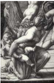
Marcantonio Raimondi d'après Raphaël (c. 1480 - 1527/1534), Le Massacre des Innocents (détail) . Gravure au burin, c. 1509