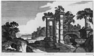
Paysage, par Pérelle

Alain Mérot vient également d'achever un livre intitulé : Les Discours du paysage , à paraître aux Éditions Gallimard, dans la collection « Bibliothèque des histoires », dirigée par Pierre Nora.