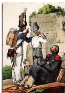
Nicolas-Toussaint Charlet (1792-1845), Frontispice de Costumes militaires français, n° 1, 1817