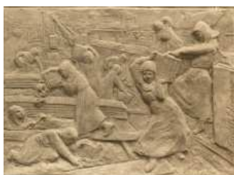
B. Mines et métallurgie. Plâtre de la médaille, datée de 1910 et signée Corneille Theunissen. Salon de 1911, n° 4004.

donne une liste des œuvres de Corneille. La découverte, en 2007, dans une collection privée, du fonds d'atelier de Corneille Theunissen, riche de plus d'un millier de photographies sur clichés verre prises le plus souvent par Corneille lui-même ou par son frère Paul, de quelque trente-cinq carnets de dessins datés entre 1881 et 1918, d'une importante correspondance, des registres des salaires et des agendas tenus par Corneille Theunissen entre 1898 et 1917, ont permis d'établir une nouvelle liste chronologique des œuvres. Une autre lecture de l'œuvre sculptée des deux frères, très largement détruit par les guerres mondiales, devient donc possible. Ont été réalisés : l'inventaire des œuvres de Paul et de Corneille Theunissen conservées au musée Jouglet d'Anzin ; les recherches sur les œuvres conservées à la Piscine et à l'Hôtel de ville de Roubaix, au musée des Beaux-Arts de Tourcoing, à la Cour des Comptes et au Grand-Palais ; l'identification de plus de 1000 photographies sur clichés verre ; le classement chronologique de 20 des 35 carnets de dessins ; l'analyse des agendas de 1898 à 1906, des carnets de salaires et la mise au point d'une base d'analyse ; la publication d'un article sur le buste en plâtre (lycée Ambroise Paré de Laval) et celui en bronze (lycée Georges Clémenceau à Nantes) de l'abbé Follioley dans Les Cahiers du Comité de l'histoire du lycée Clémenceau de Nantes .