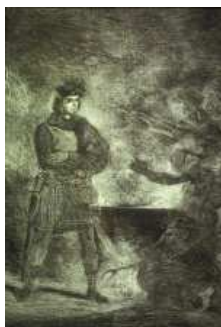
Eugène Delacroix (1798-1863), Macbeth consultant les sorcières (détail) , lithographie, 1825