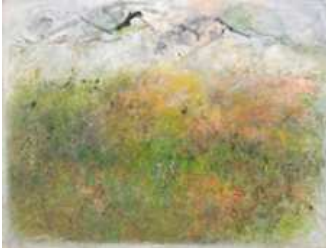
Jacqueline Lamba, Plaine de Simiane, h/t, 88,5 x 116 cm, 1964 . Remerciements à Charles Maze