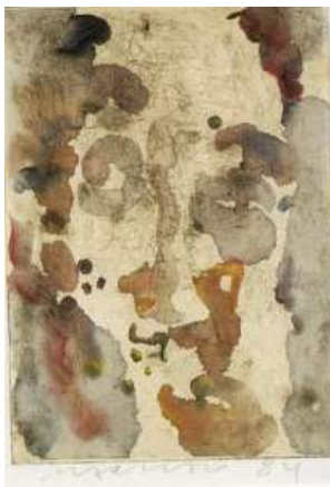
Tête, 20,8 x 14,8 cm, 1984, aquarelle sur gravure en taille-douce imprimée sur chine appliqué.