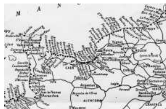
Carte de la conurbation balnéaire des côtes normandes vers 1910