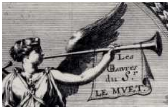
L'architecte et sa renommée, détail du frontispice des « Œuvres de Le Muet »

dans Manière de bâtir pour toutes sortes de personnes par Pierre Le Muet, rééd. de 1681