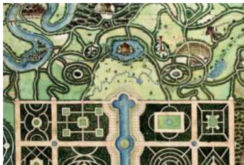
Projet idéal de jardin pour un château au nord de la Vilaine (détail), vers 1780, dessin aquarellé, Montigny-le-Bretonneux, archives départementales des Yvelines, collection Matis, A496 © Monique Mosser

L'histoire des jardins s'est épanouie depuis une trentaine d'années – au fur et à mesure que cette forme de création suscitait un regain d'intérêt après un long temps de négligence –, et s'est ouverte aux questions relevant du paysage. Elle est ainsi devenue une discipline scientifique reconnue à part entière dans certains pays, comme aux États-Unis, où la Dumbarton Oaks Research Library and Collection à Washington (Harvard University) organise des colloques annuels depuis 1971 et où la revue Studies in the History of Gardens & Designed Landscapes paraît depuis 1981. En France, les travaux sont longtemps restés timides et dispersés, en dépit de la masse de la documentation et de la diversité d'un patrimoine qui, riche de plusieurs milliers de jardins, mérite d'être mieux connu et valorisé.