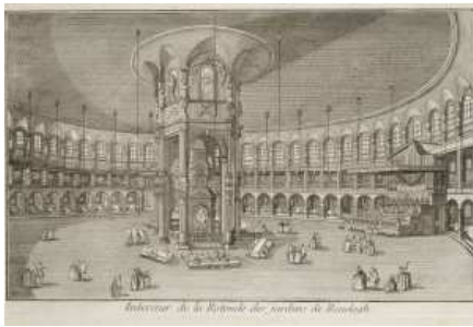
Intérieur de la Rotonde des jardins du Ranelagh, gravure du Détail des nouveaux jardins à la mode (1777) de George Louis Le Rouge.