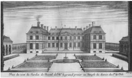
Façade sur jardin de l'hôtel du Grand prieur du Temple, par Pierre Delisle-Mansart, 1667, gravure, dans le recueil Le Grand Marot © Centre André Chastel

L'ERHAM, Équipe de recherche sur l'histoire de l'architecture moderne , revendique l'héritage intellectuel du CRHAM (Centre de recherche sur l'histoire de l'architecture moderne), créé en 1967 par André Chastel ; elle garde aussi des liens privilégiés avec le service de l'Inventaire général, le Centre André Chastel étant né de la fusion d'une première UMR Chastel et du laboratoire de recherches de l'Inventaire général (UMR 22).