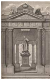
Frontispice du traité Des ordres de colonnes par Abraham Bosse, Paris, 1688

L'architecture est par essence complexe (la triade vitruvienne, firmitas, commoditas, venustas ). Elle offre aussi une amplitude extrême, l'architecte pouvant être appelé à dessiner une poignée de porte ou une ville. D'où le choix de privilégier des individus et des objets singuliers : architectes et commanditaires, édifices parisiens et franciliens, et même livres spécifiques du fonds de la bibliothèque Jacques Doucet.