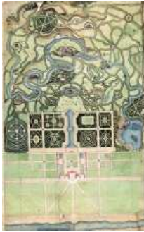
Projet idéal de jardin pour un château au nord de la Vilaine, vers 1780, dessin aquarellé, Montigny-le-Bretonneux, archives départementales des Yvelines, collection Matis, A496

L'histoire des jardins s'est épanouie depuis une trentaine d'années – au fur et à mesure que cette forme de création suscitait un regain d'intérêt après un long temps de négligence –, et s'est ouverte aux questions relevant du paysage. Elle est ainsi devenue une discipline scientifique reconnue à part entière dans certains pays, comme aux États-Unis, où la Dumbarton Oaks Research Library and Collection à Washington (Harvard University) organise des colloques annuels depuis 1971 et où la revue Studies in the History of Gardens & Designed Landscapes paraît depuis 1981. En France, les travaux sont longtemps restés timides et dispersés, en dépit de la masse de la documentation et de la diversité d'un patrimoine qui, riche de plusieurs milliers de jardins, mérite d'être mieux connu et valorisé.