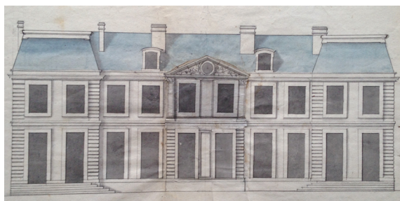
Projet de la façade sur jardin de l'hôtel de Varengeville, 1704, Archives nationales, Minutier central, LI 737

JEUDI 23 JANVIER 2020 DE 17 H À 20 H GALERIE COLBERT (2 E ÉTAGE) 2 RUE VIVIENNE 75002 PARIS SALLES INGRES, PUIS PERROT