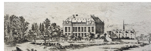
Israël Silvestre, La maison du président Le Coigneux , 1652, eau forte, Paris, Musée Carnavalet