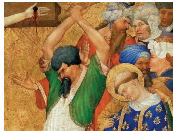
Henri Bellechose, Le Retable de saint Denis (détail), 1415-1416, panneau transposé sur toile, 162 x 211 cm. Paris, musée du Louvre, Département des peintures, M.I. 674