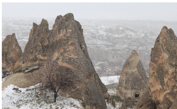
Vue d' El Nazar Kilise