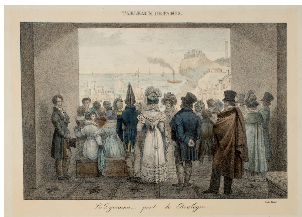
Marlet, Le Diorama... port de Boulogne, lithographie, s. d., coll. George Eastman House, Rochester

Le nom de Daguerre est resté attaché à la découverte de la photographie. De lui, on connaît moins cette invention spectaculaire, restée enfouie dans le XIX e siècle, le diorama. Daguerre a pourtant réussi ce tour de force qui consiste à introduire du mouvement dans la peinture même. Ce mouvement, qui est obtenu grâce à la transparence et à un système d'éclairage ingénieux, fait apparaître des figures peintes au gré de la luminosité. Le jour vient remplacer la nuit, un éboulement obstrue une vallée paisible, l'orage menace une journée radieuse, des moines pénètrent dans le chœur d'une église. Si le diorama hérite des principes picturaux de la perspective, il n'en reste pas moins que cette invention participe aussi directement du théâtre. Il concentre un des moments clés de la construction d'une histoire du spectaculaire qui n'attend plus que le cinéma pour trouver son expression la plus complète. Balzac ne s'y est pas trompé en qualifiant le diorama de « merveille du siècle ». Aujourd'hui, le diorama de Bry-sur-Marne est le seul vestige qui témoigne des prodiges techniques et esthétiques de ce grand artiste-inventeur. Pour l'historien comme pour le spectateur curieux, cette longue nef en trompe-l'œil est une fenêtre ouverte sur les révolutions optiques du XIX e siècle.