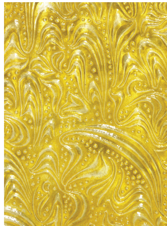
Verre imprimé plaqué jaune, n° 14, « Oriental » édité par Saint-Gobain.

MERCREDI 31 JANVIER 2024 DE 18 H À 20H GALERIE COLBERT SALLE INGRES (2 e ÉTAGE) 2 RUE VIVIENNE 75002 PARIS ENTRÉE LIBRE