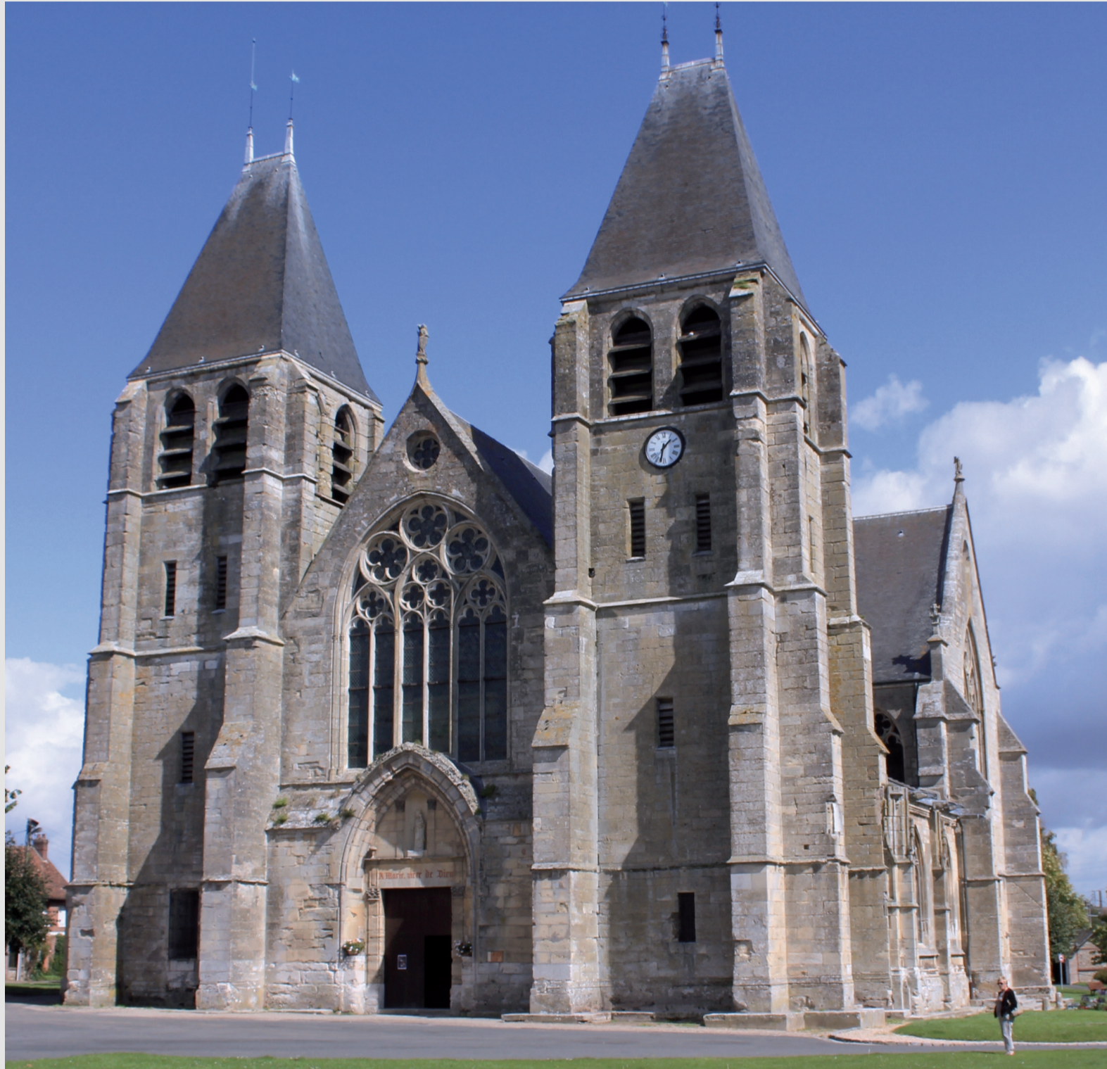
Écouis (Eure), collégiale Notre-Dame, 1311-1313

Galerie Colbert, 2 rue Vivienne, 75002 Paris Salle Ingres, 2 e étage, entrée libre